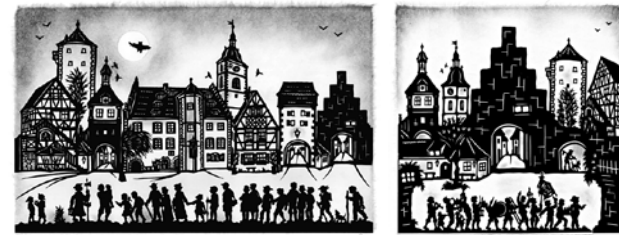
Die große Nachwächerführung in Sommerhausen Frohe Festtage in Sommerhausen