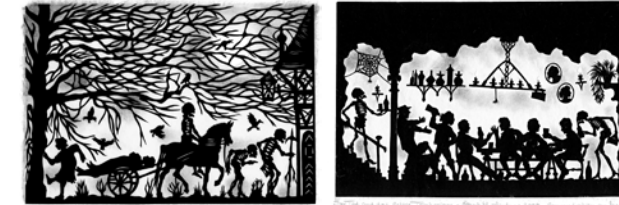
Dem Tod von der Schippe springen Der Tod und das letzte Trinkgelage