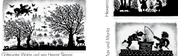
Göttervater Wotan und sein Hengst Sleipnir Max und Moritz