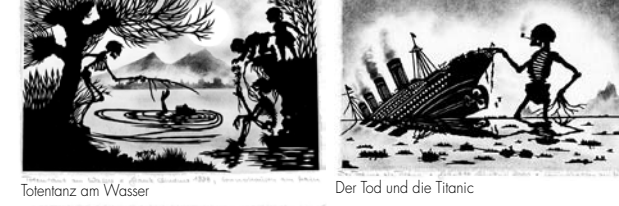
Totentanz am Wasser Der Tod und die Titanic