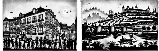
Kirchweihausklang am Goldenen Ochsen in Sommerhausen Blick auf die Festung Marienberg in Würzburg