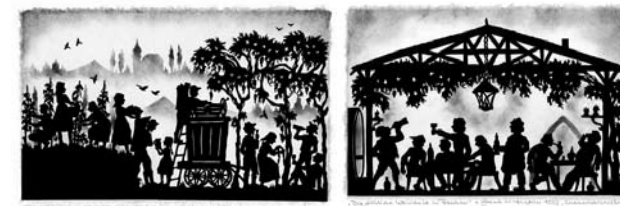
Weinbergglese in der guten alten Zeit Die fröhliche Weinlaube in Franken