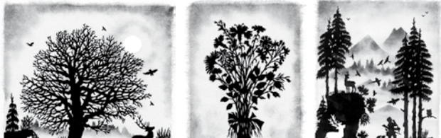
Mein Freund der Baum Blumengrüße Waidmannsheil