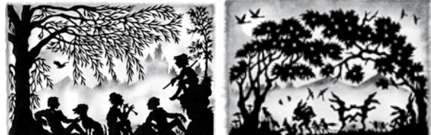
Friedlicher Feierabend der Hirten Frühlingsfest der Tiere