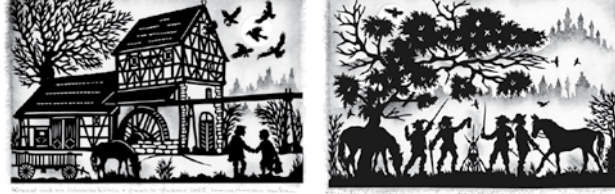
Krabat und die schwarze Mühle Die vier Musketiere