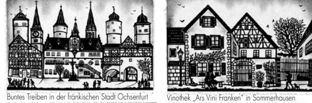
Buntes Treiben in der fränkischen Stadt Ochsenfurt Vinothek „Ars Vini Franken“ in Sommerhausen