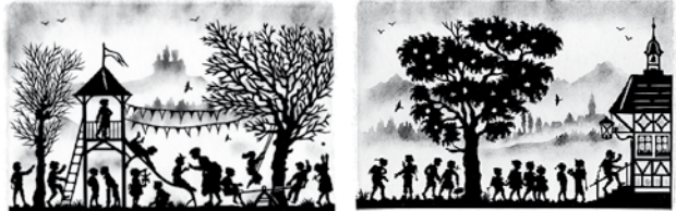
Frühjahrstreiben im Kindergarten Schöne Schulzeit auf dem Lande