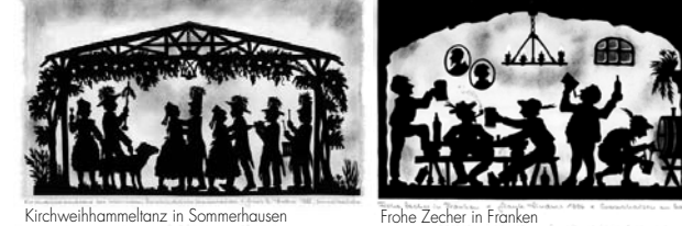
Kirchweihhameltanz in Sommerhausen Frohe Zecher in Franken