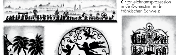
Fronleichnamprozession in Gößweinstein in der Fränkischen Schweiz Der Leidensweg Christi