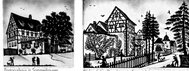
Pastoriushaus in Sommerhausen Blick auf den Grundturm in Sommerhausen