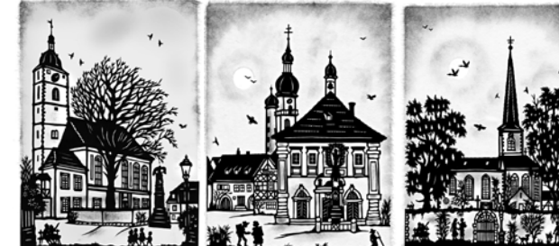
Bartholomäuskirche in Sommerhausen Marktplatz in Eibelstadt Maria Schnee in Kleinochenfurt