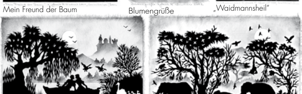
Abendromantik auf dem See Elefantenausflug durch die Savanne