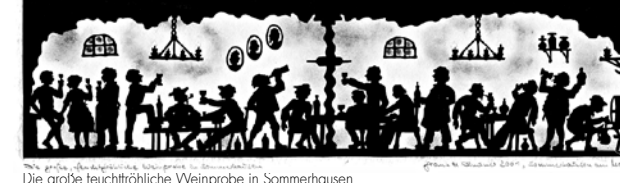
Die große teuchtröhliche Weinprobe in Sommerhausen