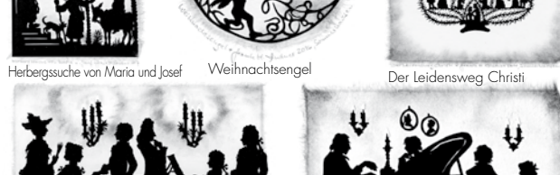
Herbergssuche von Maria und Josef Weihnachtsengel