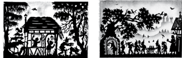
Die Bremer Stadtmusikanten Schneewittchen und die 7 Zwerge