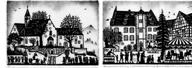
Fronleichnamprozession am Kloster Engelberg Weihnachtsmarkt in Sommerhäuser Schlosshof