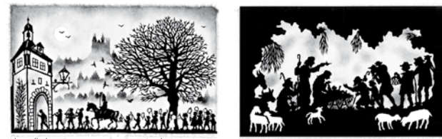
Abendlicher Laternenumzug am Sankt Martinstag Kommet ihr Hirten (Krippenmotiv)