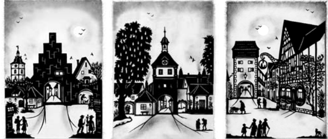
Torturmtheater Sommerhausen Ochsenfurter Tor in Sommerhausen Blick auf das Maintor in Sommerhausen