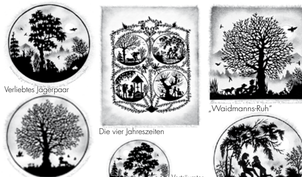
Verliebtes Jägerpaar Die vier Jahreszeiten Waidmanns-Ruh