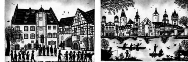
Kirchweihparade im graflichen Schloss in Sommerhausen Freizeitvergnügen am Main vor der Kulisse der Stadt Kitzingen