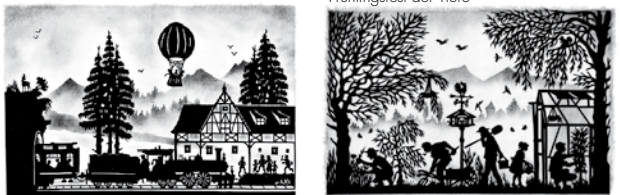
Georg's fröhliche Ausflugsfahrten durch die Welt Großer Frühjahrsputz im Garten