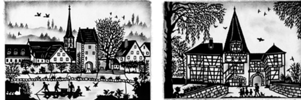
Mainfischer bei Frickenhausen am Main Rödelseer Tor in Iphofen