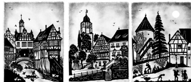
Malerwinkel im Marktbreit Rathausplatz in Winterhausen Bürgerturn in Sommerhausen