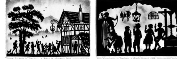
Frohe Einkehr in Franken Alter Winzerkeller in Franken