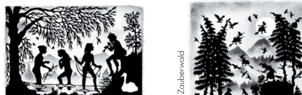
Naturgott Faun und die badenden Jungfrauen Hexenrat im Zauberwald