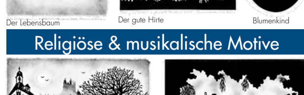
Der Lebensbaum Der gute Hirte Blumenkind