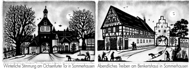
Winterliche Stimmung am Ochsenfurter Tor in Sommerhausen Abendliches Treiben am Benkertshaus in Sommerhausen