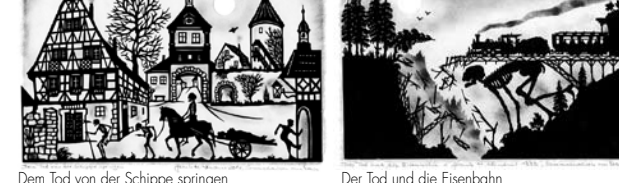
Dem Tod von der Schippe springen Der Tod und die Eisenbahn