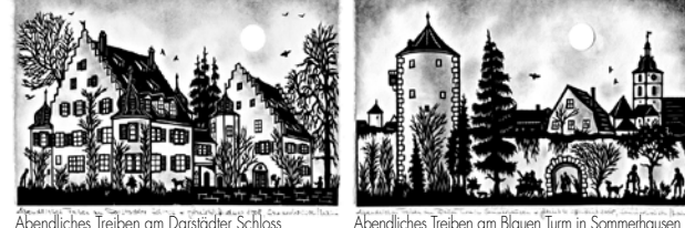
Abendliches Treiben am Darstädter Schloss Abendliches Treiben am Blauen Turm in Sommerhausen