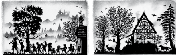
Der Rattenfänger von Hameln Der Wolf und die sieben Geißlein