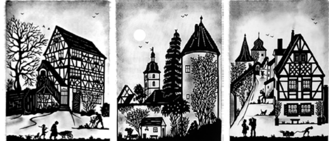
Herbstl. Treiben am hist. Eichamt in Sommerhausen Blick über die Sommerhäuser Dorfmauer Blick a. d. Rumoknechturm in Sommerhausen