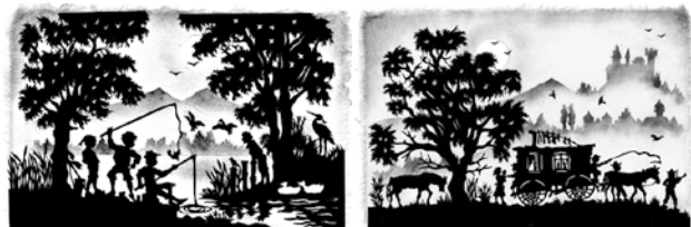
Petri Heil Zigeunerleben