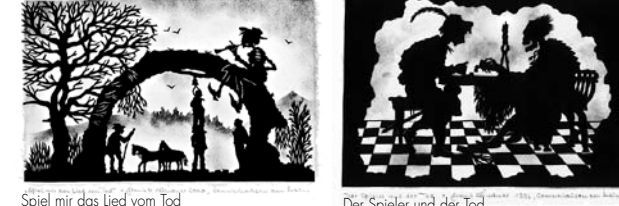
Spiel mir das Lied vom Tod Der Spieler und der Tod