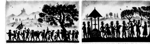
Gratulanten auf dem Weg zum Jubilar Huldigung an die Sommerhäuser Weinprinzessin