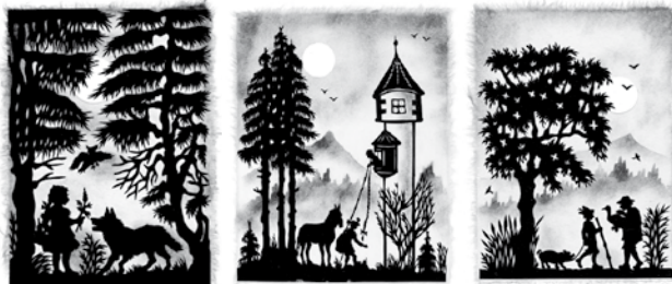
Rätkäppchen Rapunzel Hans im Glück