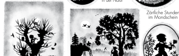
Unbeschwerter Start ins Leben Verträumtes Fließenspiel in der Natur Zärtliche Stunden im Mondschein